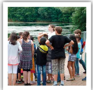
Das grüne Klassenzimmer – Schulklasse am Schultheis-Weiher

Eine kleine Exkursion an den Ufern des in den 1980er Jahren unter Naturschutz gestellten Schultheis-Weiher im Rumpfenheimer Mainbogen ermöglicht Einblicke in den Lebensraum Teich – und neue Perspektiven auf seine zahlreichen Bewohner. Die Beobachtung und Erforschung von kleinen wie großen Lebewesen, die alle ihren Teil zum Naturhaushalt beitragen, machen deutlich: Der Schultheis-Weiher ist viel mehr, als nur ein Badesees!