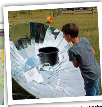
Spannend – mit dem Solarkocher kochen