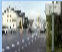
Stadtteil Bieber und Waldhof 63073 OF